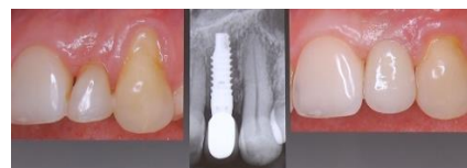
※写真はセミナーをイメージしたもので実際のプレゼン資料ではありません。